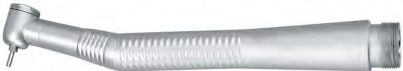
DQ.2475.02 2-holes Borden / złącze 2-otworowe Borden DQ.2475.04 4-holes Midwest / złącze 4-otworowe Midwest Standard Head / Główka Standard

Standard Torque, wrench type chuck, ceramic bearing Główka Standard, mocowanie wiertel za pomocą klucza, łożyska ceramiczne