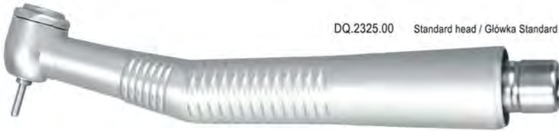
DQ.2325.00 Standard head / Główka Standard

Standard Torque, push button chuck Główka Standard, wymiana wiertel za pomocą przycisku