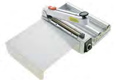
DQ.9000.00 Complete with roll stand and working table Komplet zawiera stojak na rękaw i stolik