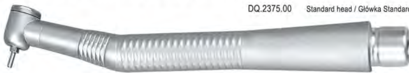
DQ.2375.00 Standard head / Główka Standard

Standard Torque, wrench type chuck Główka Standard, mocowanie wiertel za pomocą klucza