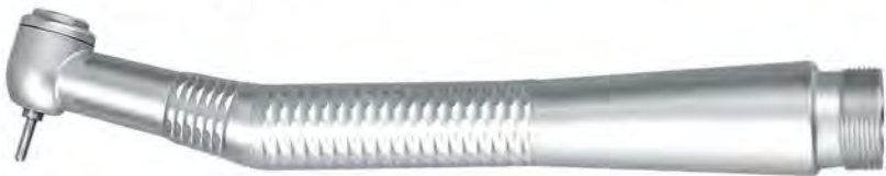
DQ.2425.02 2-holes Borden / złącze 2-otworowe Borden DQ.2425.04 4-holes Midwest / złącze 4-otworowe Midwest Standard Head / Główka Standard

Standard Torque, push button chuck, ceramic bearing Główka Standard, wymiana wiertel za pomocą przycisku, łożyska ceramiczne